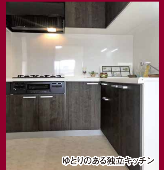
ゆとりのある独立キッチン