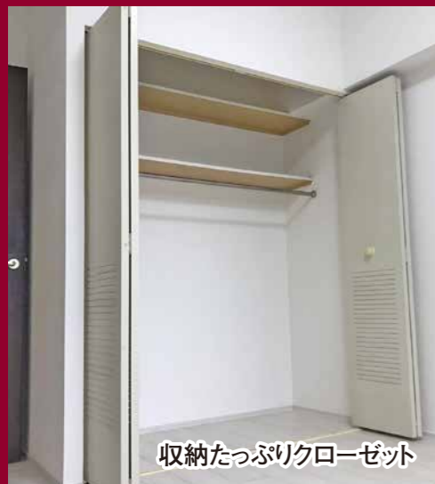
収納たっぷりクローゼット