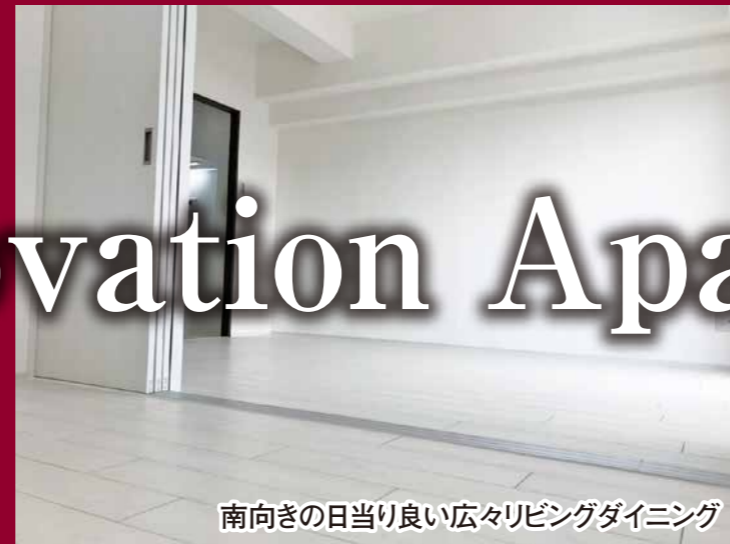
南向きの日当たり良い広々リビングダイニング